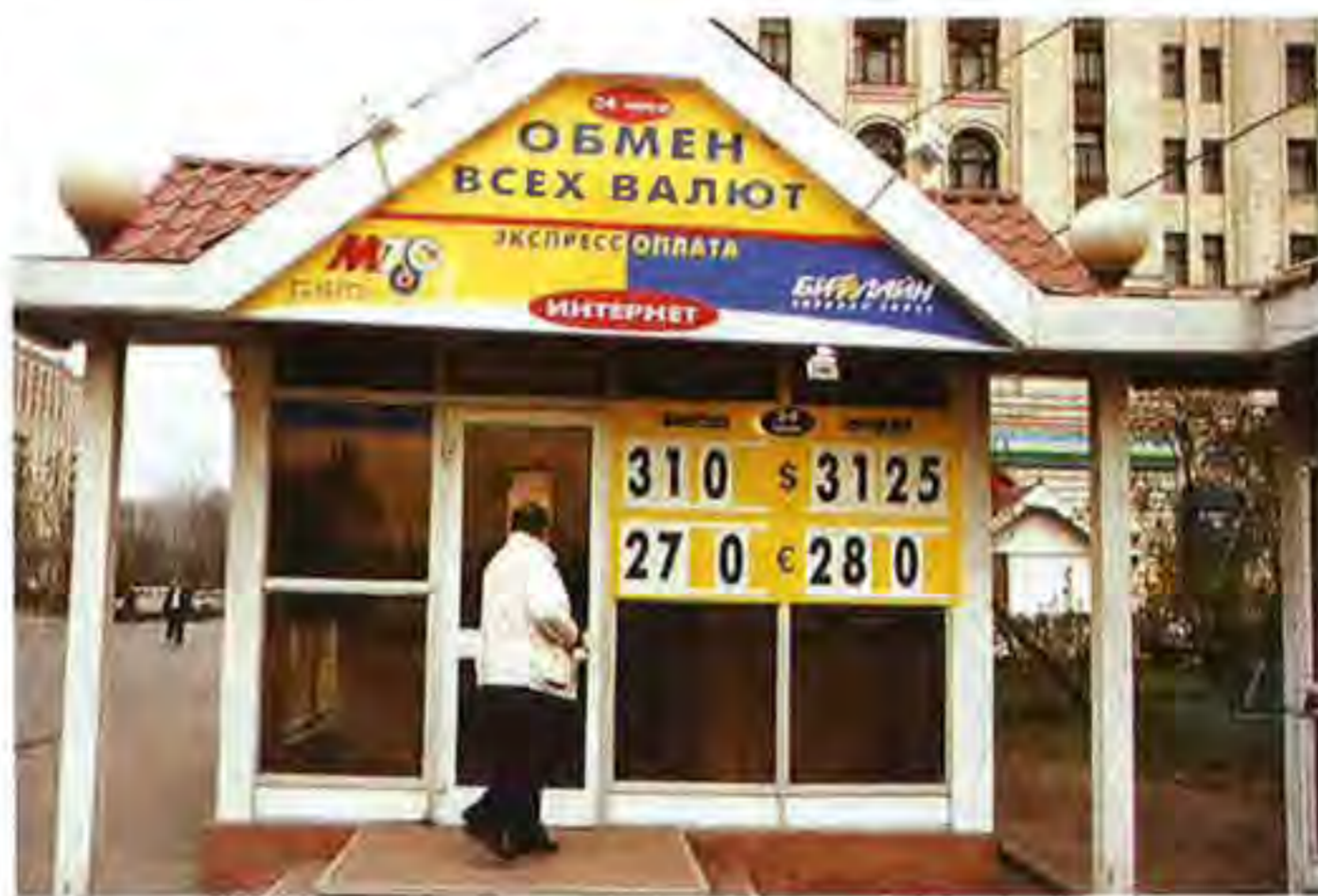
Los analistas esperan que el dólar, que ahora cotiza a 31 rublos, como puede apreciarse en la foto, alcance los 35 rublos a finales de año.

Es urgente restablecer la confianza. Y a ello se ha lanzado el equipo de sampeterburgueses de Vladimir Vladimirovitch Putin. Con cuidado, porque las carga el diablo, las mafias y los oligarcas. Sin precipitaciones, pero golpe a golpe. El primero fue en diciembre pasado, con una ley que establece un primer cuadro de reglamentación. El 1 de enero de 2004, la contabi-