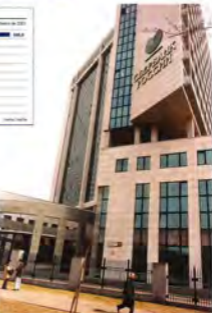
La marca y edificio más sólido del Sberbank, en la calle Varshava de Moscú.

■ Citibank le sigue los pasos. Por fin se que el Sber Bank Holding Ltd. está dando el paso: en Colombia.